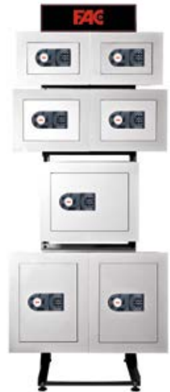
para cajas de empotrar Ref.99088