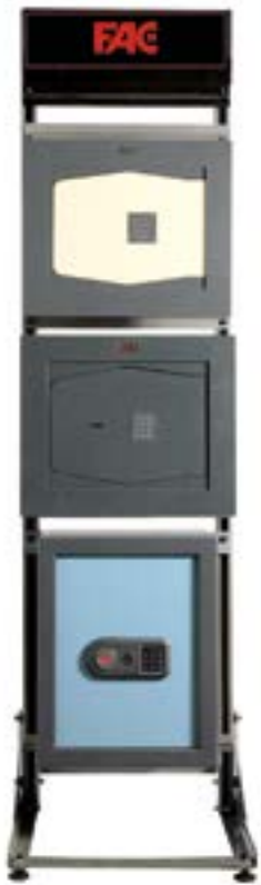
para cajas de sobreponer (necesario complemento soportes) Ref. 99029 Ref. 99088

expositores polivalentes para cajas fuertes