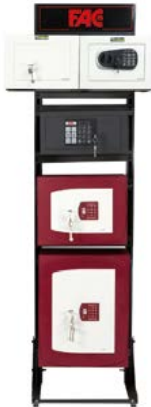
para cajas de sobreponer (necesario complemento soportes) Ref. 99088 Ref. 99030